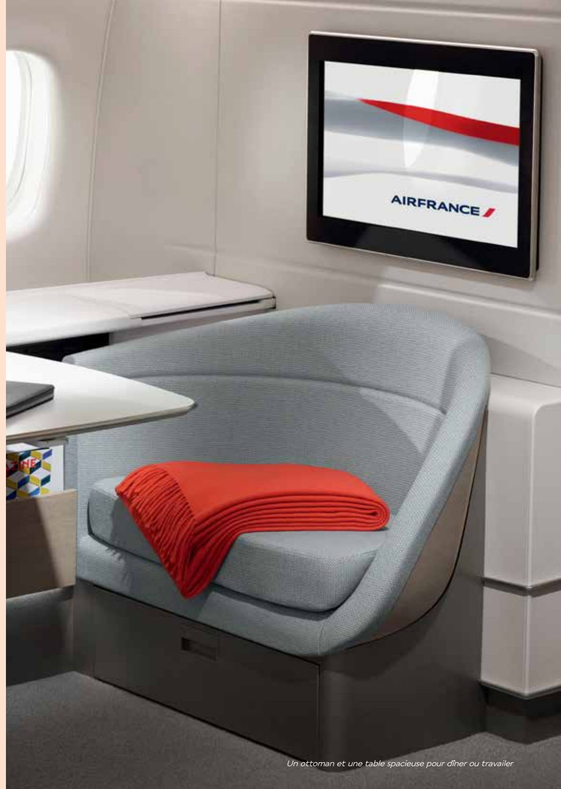
Un ottoman et une table spacieuse pour dîner ou travailler

Côté lumière, c'est aussi au choix. L'intensité lumineuse est composée par le passager : lumière d'ambiance, liseuse orientable, ou encore lampe de chevet habillée d'hippocampes. Les stores automatiques des hublots s'abaissent d'une simple pression du doigt.