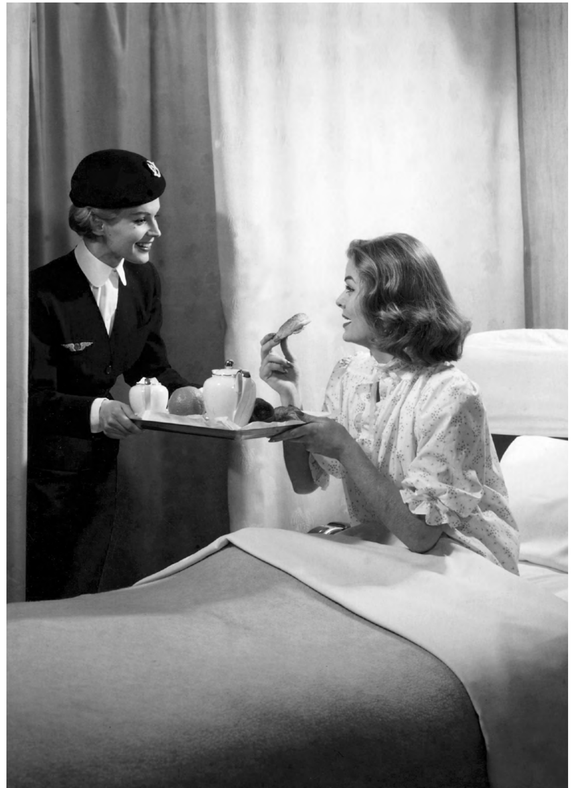
Années 1950, le service « Parisien Spécial » à bord du Lockheed Super Constellation.

Dans les années 1950, la compagnie se procure des Lockheed, version « Constellation », « Super Constellation » puis « Super Starliner », l'un des plus beaux avions à hélice de l'histoire des quadrimoteurs. C'est l'âge d'or des services de luxe d'Air France et tout le prestige français prend alors son envol. En 1953, le mythique service « Parisien Spécial » vers New York propose à bord du Super Constellation 34 fauteuils-couchettes et 7 cabines privatives dotées de lits. À bord, on retrouve déjà de la vaisselle en porcelaine de Limoges issue des manufactures Bernardaud et Haviland, des verres en cristal Saint-Louis et Baccarat, et des couverts en argent Christofle. Au menu, foie gras couronné à la truffe, éventail de truite à l'estragon, filet de sole et bombe glacée feuille d'automne.