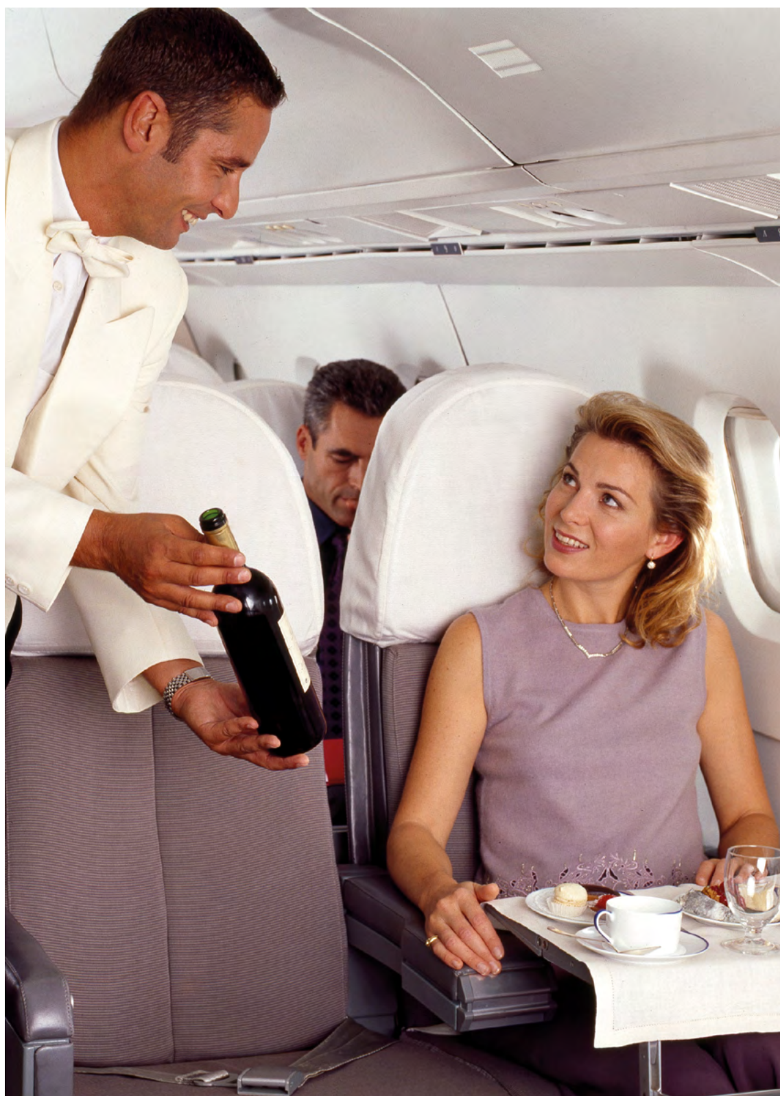
Années 1990, le service à bord du Concorde.

En 1970, l'arrivée du Boeing 747 lance une révolution qui mènera à la démocratisation du transport aérien. Dans ce géant des airs équipé d'un pont supérieur, Air France accueille plus de 500 passagers. La première classe n'en préserve pas moins son caractère exclusif et intime : un salon privatif offre sa bulle de tranquillité aux voyageurs, les sièges s'inclinent pour un confort accru. Cette cabine continue ainsi d'offrir un service d'excellence.